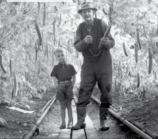
Gurkorna inspekteras.