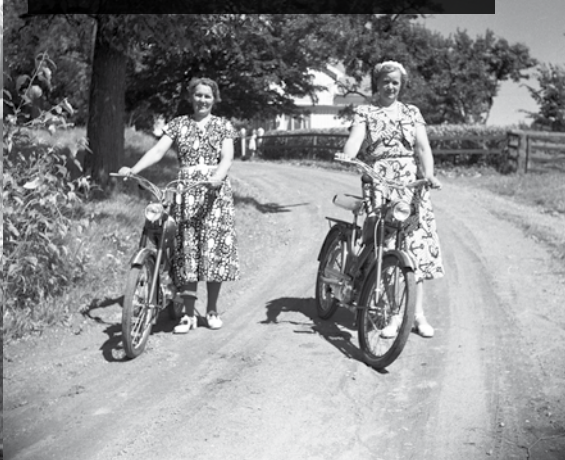
I närheten av kyrkans sommarhem i Edeskvärna, mitten 1950-talet.