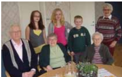
Generationsmötet i Eksjö resulterade i projektet "Sverige för 100 år sedan".