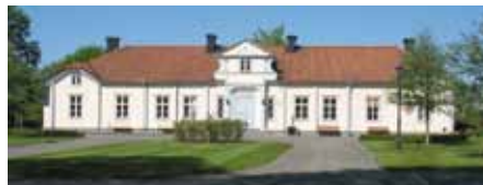
Ryhovs herrgårdsbyggnad, från 1750-talet vid Rocksjön i Jönköping, är nu kursgård.