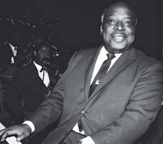
Count Basies storband.