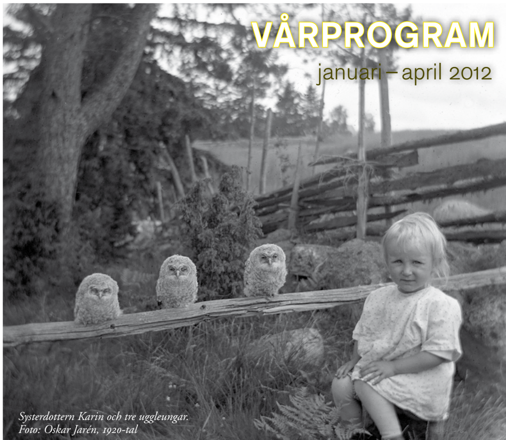
Systerdottern Karin och tre uggleungar. Foto: Oskar Jarén, 1920-tal

Museet har börjat publicera bilder från samlingarna på internet. Denna och många andra bilder finns på www.flickr.com/jkpglm