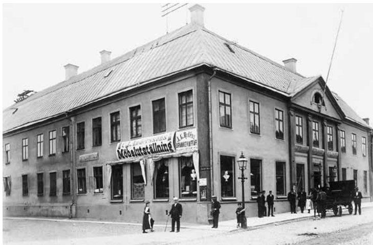
Före detta Societetshuset omkring år 1900 vid Östra Storgatan 40 mot Hovrättstorget i Jönköping.