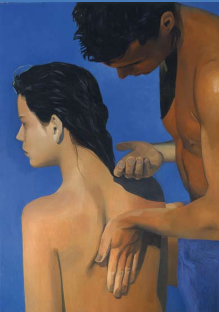
Cecilia Edefalk En annan rörelse, 1990 © Cecilia Edefalk

http://lingonline.jonkoping.se/oppet.htm