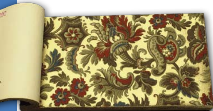
Tapetbok från Näsby tapetfabrik, 1890-91 års kollektion.