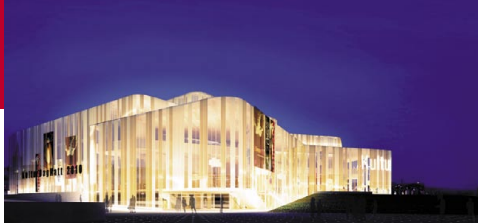
SMOT Rendering av Wingårdh Arkitektkontor AB