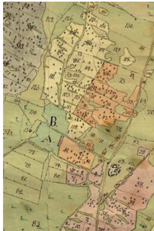
Karta över Vipersjö by, 1799.