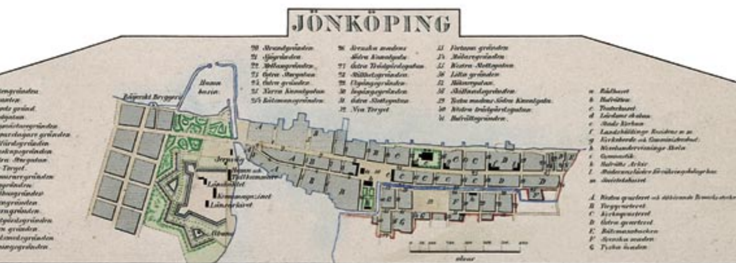
Karta över Jönköping (beskuren), 1855.

Gå runt och njut av utsökt ritade gamla kartor – för visst är de vackra!