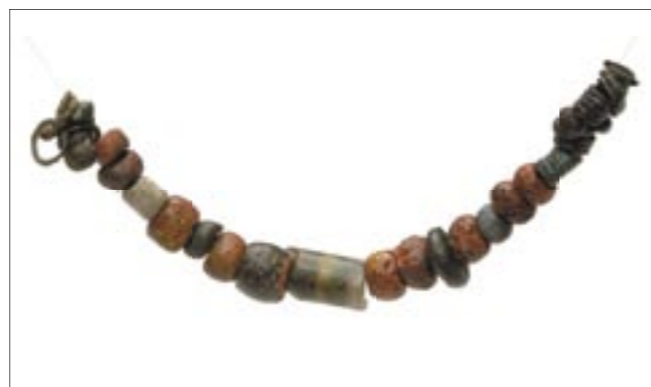
Pärlor av glas och brons. Fynd från en 800-tals grav i Rogberga.

DU ÄR HÄR – ett antal utställningar, föreläsningar, visningar och workshop som alla berör temat karta.