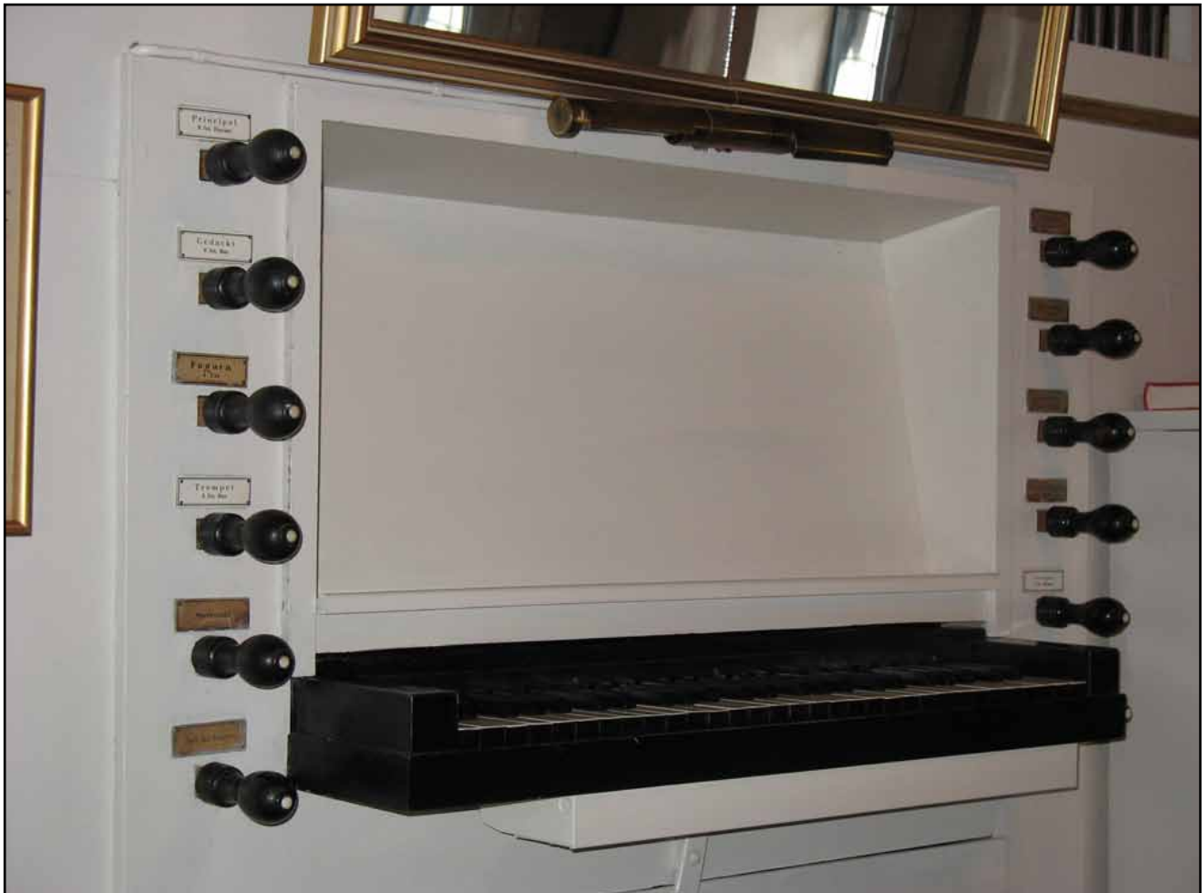
Spelbordet efter restaurering, rensat från kablage och strömvred, pedalarmatur inmålad, registerskyltar kompletterade, ny notbräda, bättringsmålning, rengöring.