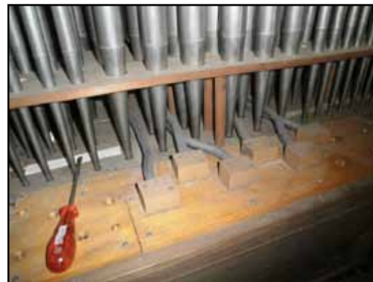
Rörflöjten från 1942 sitter på en ny pipstock på trumpetens gamla plats. Zinkrör förbinder den med basoktaven i Gedacht 8'.