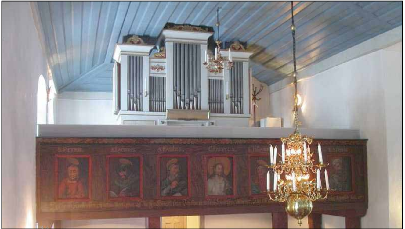
Nordströmorgeln fotograferad 2005. På orgelhusets kortsidor är svällverksluckor från 1942. Den rent vita färgsättningen är ett resultat av kyrkorummets ommålning 1984.