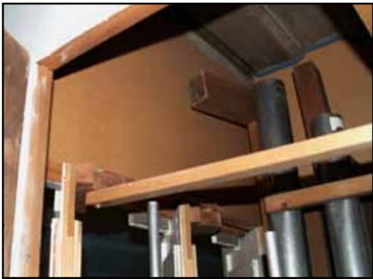
Orgelhuset är invändigt klätt med masonit för att fungera som crescendoverk genom kortsidornas luckor. Detta syns även bakom fasadpiporna.