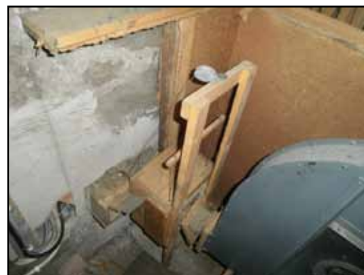
Den gamla fläkten.