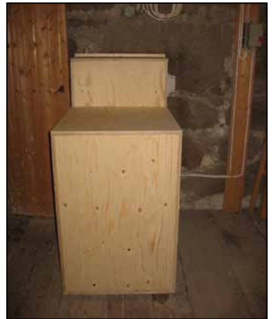
Ny fläkt med inklädnad i tornets andra våning.

Sven Nordströms Trumpet 8' påträffades på skolhusets vind och kunde restaureras och sedan återbördas. Rörflöjten från 1942 demonterades med tillhörande pipstock och zinkrörskopplingar. Stämman magasineras i tornet. Flera av trumpetuppsatserna var kraftigt deformerade, men kunde riktas. Hål har lagats och nederdelen bytts ut på flera. Några uppsatser i diskanten är helt nyttillverkade och patinerade med järnoxid. Trumpetstockarna var