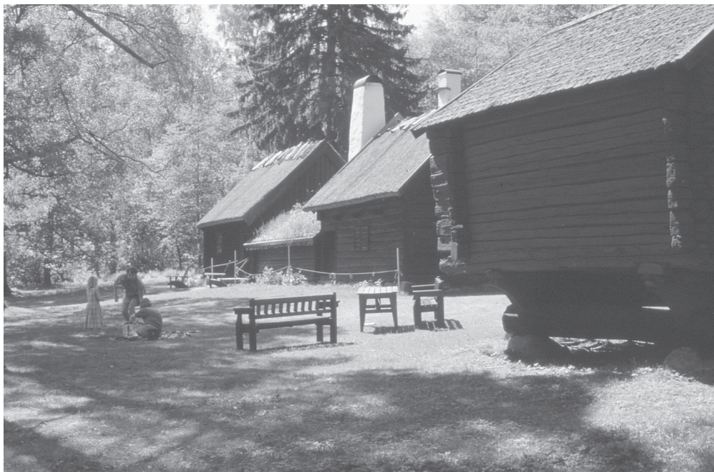
Friluftsmuseet i Jönköpings Stadspark. Tillhör Stiftelsen Jönköpings läns museum.

I evenemangskalendern ingår hembygdsföreningar som är anslutna medlemmar i Jönköpings läns hembygdsförbund.